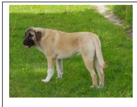
Babacan, 7 měsíců