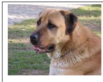
Náš první anatolský pastevecký pes (pes) - TAPU du Val de la Boissère.

Původních mohutných psů žijících v této oblasti si vysoce cenili také Babyloňané. Archeologické nálezy z Mezopotámie dokazují, že psi typu mastifa se používali k lovu a v boji. Britské muzeum v Londýně má ve svých sbírkách dobře zachovaný reliéf z babylonské říše zobrazující psa, který silně připomíná dnešního anatolce. Na vzhledu dnešního anatolce se nepopíratelně podíleli také dlouhonozí a hbití lovečtí psi z jižních oblastí Mezopotámie. Jejich vliv je dodnes patrný v dolní linii, dlouhých končetinách, suché tlamě a rezervované povaze anatolských pasteveckých psů.