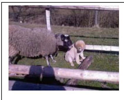
Coban, 3 měsíce

Anatolci jsou obecně nejvhodnější do rodin, ve kterých se psům nikdy nepodařilo převzít velení. Rozhodneme-li se pro ně, musíme být ochotni věnovat dostatek času jejich dokonalé socializaci a výchově.