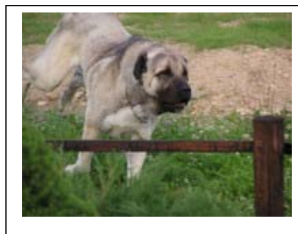
Fir v akci, 3 roky