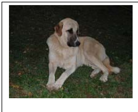
Basari, 1 rok

Anatolské pastevecké psy potkáváme v Turecku i dnes – stráží stáda svých majitelů se stejnou věrností a nepodplatitelností jako dnes.