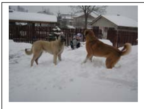
Ay a Tapu

Donutit anatolského pasteveckého psa k útoku, pokud sám situaci nepovažuje za nebezpečnou, může být velmi obtížné – ale na druhou stranu budeme-li psa neustále pobízet, může se rozzlobit a pak nebude nijak snadné ho zastavit na povel. Anatolský pastevecký pes nemá nijak zvlášť vyvinutý kořistnický pud, ale má silnou vazbu ke své „rodinné jednotce“. Má silný vlastnický a ochranný vztah ke zvířatům a lidem, s nimiž vyrůstal, a věrně chrání a brání všechno, co pokládá za součást svého teritoria. Protože má silný „vlastnický pud“, který je součástí jeho vztahů s rodinou, nebude se chtít dělit o své „stádo“ s jiným strážním psem. Vždy je důležité vybudovat správné hierarchické uspořádání, jež je pak stabilní a trvalé.