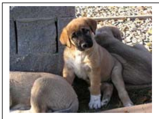
Štěňata Ely ve věku 6 týdnů

Na tomto místě bychom se pravděpodobně měli zmínit i o tom, že v Turecku existují také další plemena pasteveckých psů – třeba akbaš, který je čistě bílý nebo krémový, má obecně delší srst a je protějškem například slovenského čuvače nebo pyrenejského horského psa – toto plemeno dosud nedosáhlo mezinárodního uznání a kromě země původu ho uznává jen americká chovatelská organizace UKC.