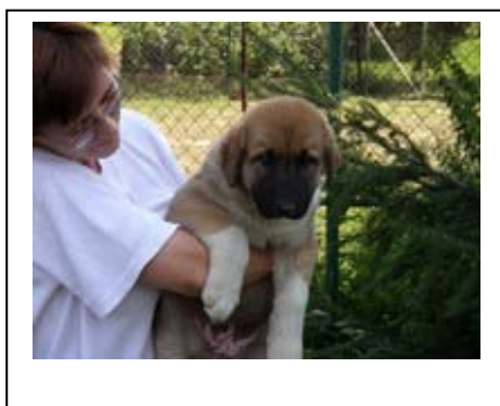
Curetkar, 9 týdnů