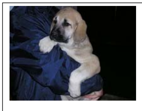
Daniska, 9 týdnů