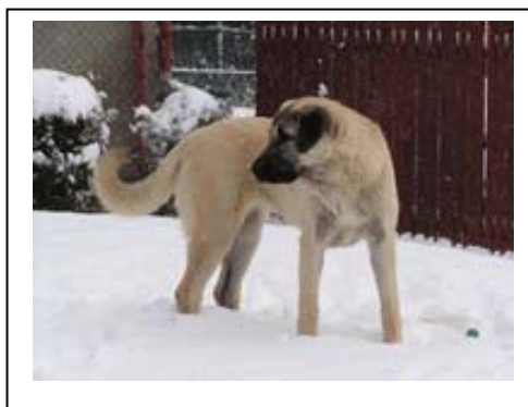
Ay, 7 měsíců