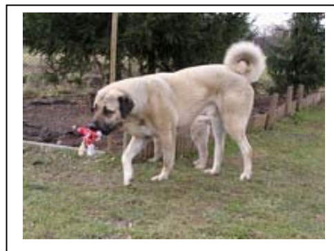
Zeki vychovává štěňata

Se štěnětem je třeba hned od malička manipulovat – prohlížet uši, kontrolovat zuby a tlapy, kartáčovat srst. Nečekejte, až se psovi zapíchne hřebík do tlapy, abyste najednou zjistili, že máte psa, který si tlapu nenechá ošetřit. Štěně musí znát laskavé jednání a manipulaci, dokud je malé, abyste si mohli jemně vynutit jeho trpělivost a poslušnost.